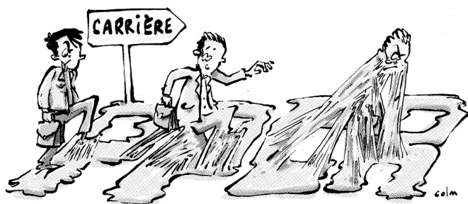
Grille d'avancement des professeurs agrégés classe normale, avant et après le 01/09/2017

Le nouveau rythme d'avancement unique modifie cette organisation.